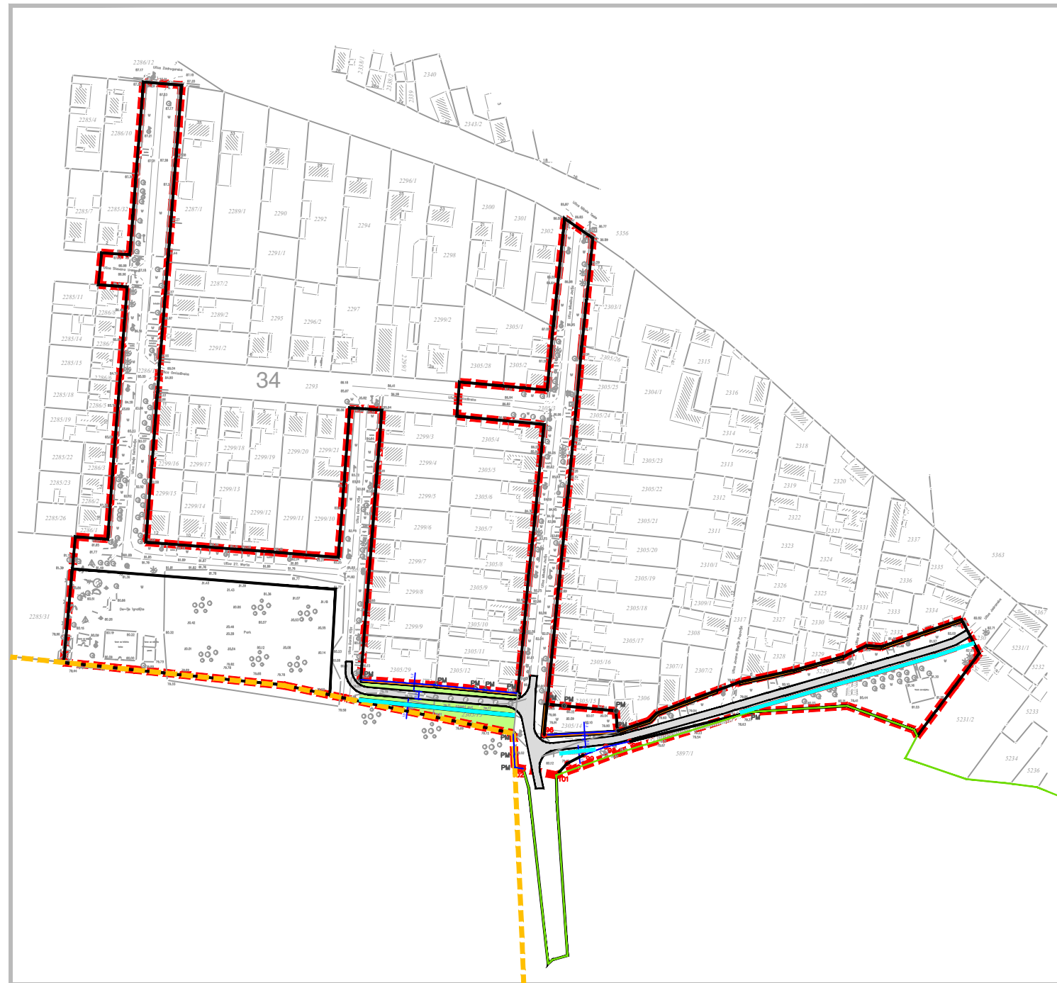
ПЛАН РЕГУЛАЦИЈЕ ЈАВНИХ ПОВРШИНА - УЛИЧНИ КОРИДОРИ ЛОКАЦИЈА В